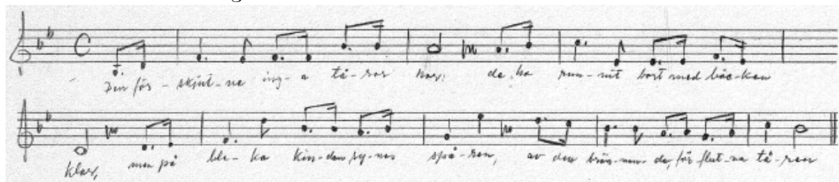
Ex. 7. "Den förskjutne". Uppteckning från Södermanland signerad: H. G. Svensson, Folkskollärare, Walinge och Stigtomta, 27 april 1910.

En uppteckning i folkkommissionens notsamling heter ”Den förskjutne” och innehåller visans första vers som börjar ”Den förskjutne inga tårar har”. 29 Texten överensstämmer i övrigt med Sandsténs version från 1873 och har en durmelodi.