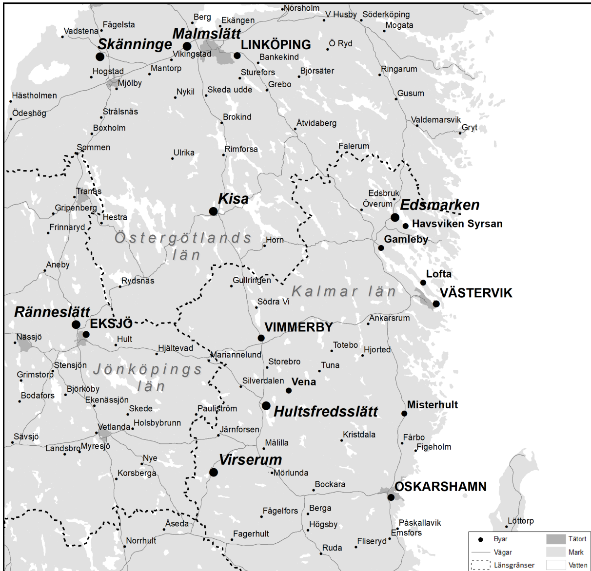
Karta 1. Sandsténs verksamhetsområde i Östergötland och nordöstra Småland. Marknadsorter och exercishedar kursivt.

instansade hål, en sorts hålkortsremсор liknande dem som användes i självspelade pianon. Detta var en flexiblare och billigare lösning, men stiftvalspositiven användes långt därefter (Zeraschi, 1976; Lindwall, 1985; Nöring, 1985; Sörenson, 1972).