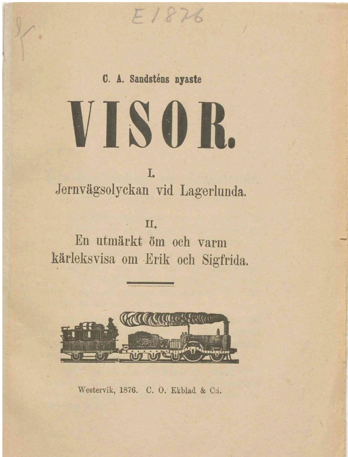
Fig. 5. C. A. Sandsténs nyaste visor . Tryck från 1876 i antikvastil.